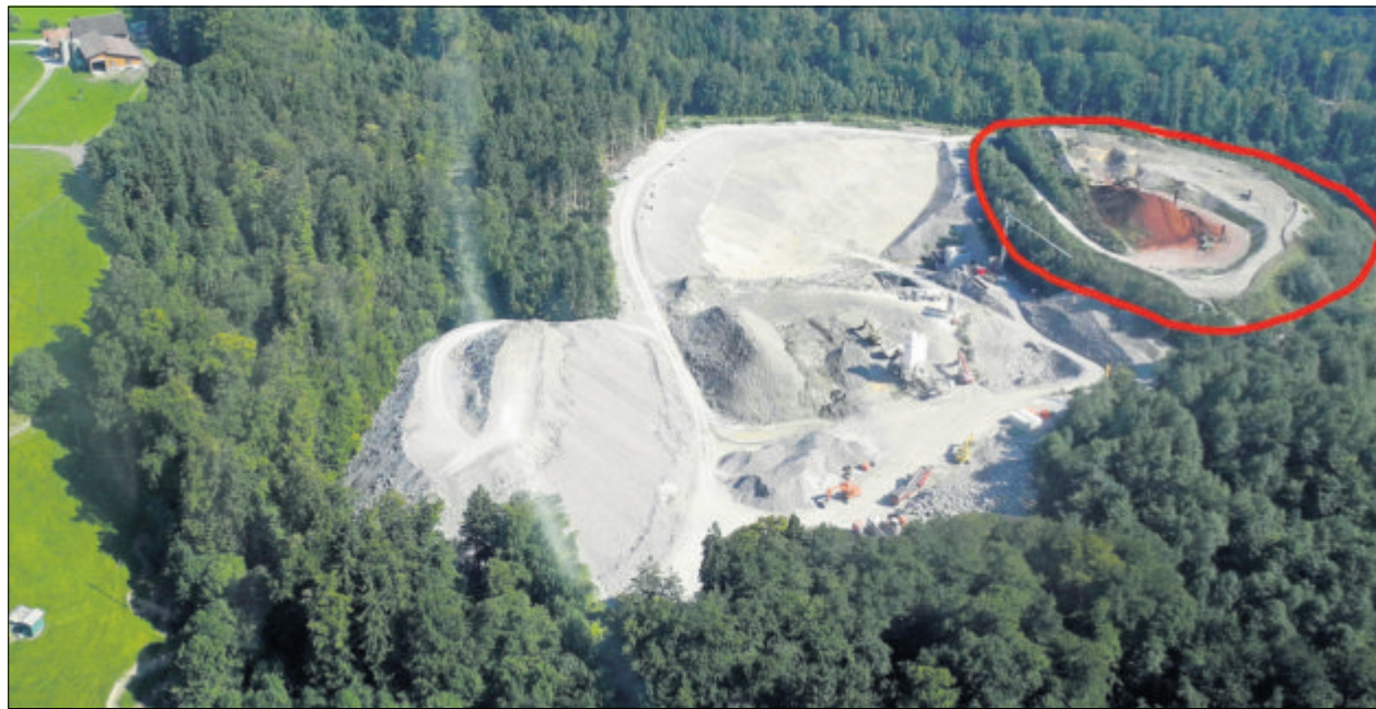
Die Deponie 3 im Cholwald (rot eingezeichnet) wird vermutlich 2015 vollständig gefüllt sein.