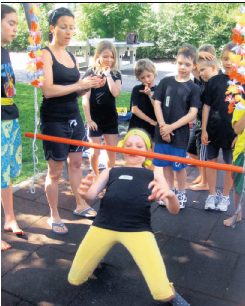
Eine Schülerin tanzt bei der Olympiade unter einer Latte durch. PD

STANS pd/red. Bei herrlichem Sonnenschein sind am vergangenen Freitag 270 Schüler mit ihren selbst entworfenen Flaggen ins Olympiagelände beim Schulhaus Turmatt geschritten. Die Athletinnen und Athleten absolvierten dabei 15 Disziplinen wie Skifahren, Surfen,